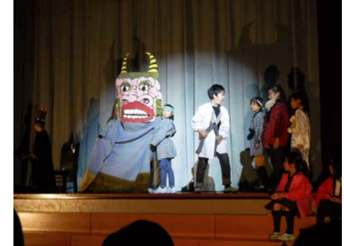
4年生「じごくのそうべえ」