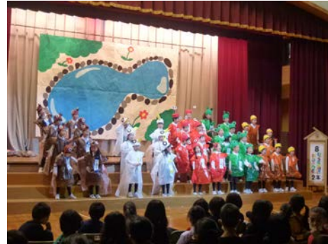
2年生「ひょうたん池はおおさわぎ」