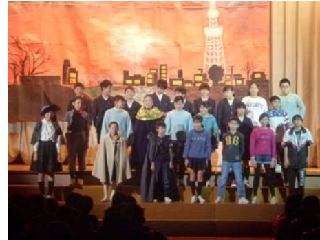
6年生「三つめの願い」