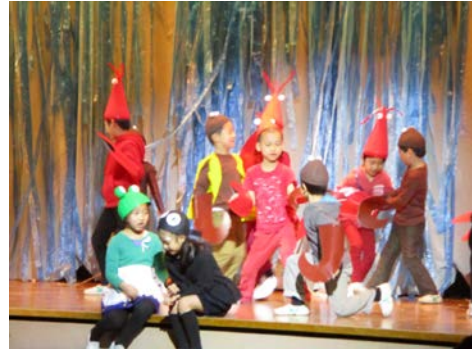
1年生「おたまじゃくしの101ちゃん」

2月15日(金)、体育館に児童全員が集まり、児童同士が鑑賞し合う学芸会が行われました。どの学年も練習の成果を発揮して素晴らしい劇をし、他の学年の劇を楽しみました。16日(土)には児童数の2倍以上の保護者の方々をご来場くださり、張り切った児童の最高の演技で体育館が感動につつまれました。衣装づくりをはじめ、練習の相手や励ましなどのご協力をありがとうございました。