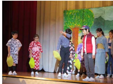
5年生「ユタと不思議な仲間たち」