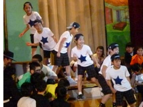
3年生「オズくんと魔法使い」