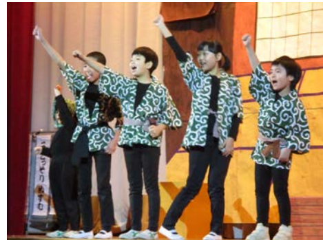
ひまわり学級「できごころ」