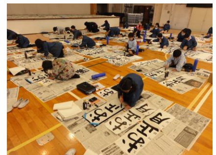
前年度席書会の様子