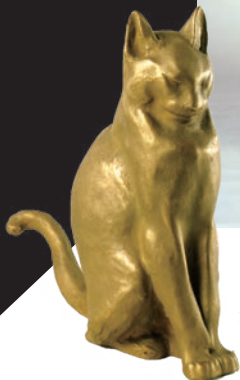
朝倉文夫《猫(金メタリコン)》1922年