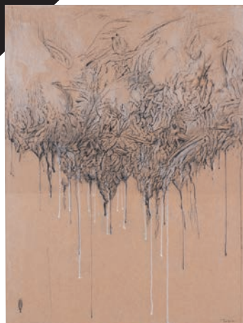
戸谷成雄《湿地帯》1989年 展示期間:11月1日~12月15日