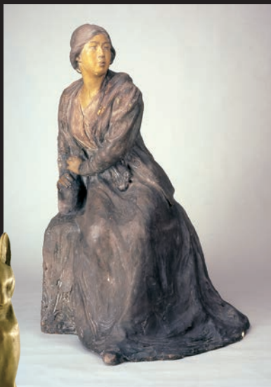
朝倉文夫《松井須磨子像》1914年