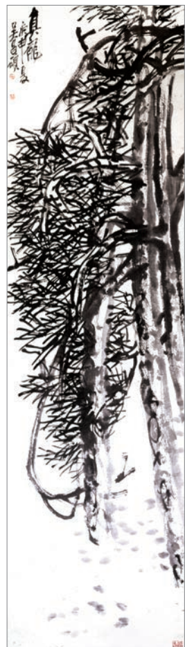
吳昌碩《老松園(真龍)》1920年 展示期間:9月7日~10月30日