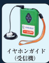
イヤホンガイド (受信機)