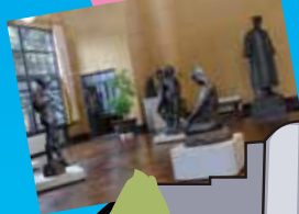
Musée de la sculpture ASAKURA