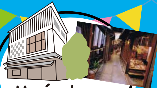
Musée de Shitamachi