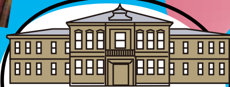
Sogakudo de l'ancienne école de musique de Tokyo