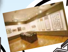
Musée de la calligraphie